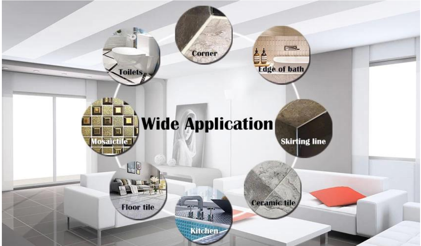
圖 1 示 出 了 該 塗 料 之 廣 泛 應 用 範 圍 。

此 塗 料 適 用 於 各 種 地 磚 之 塗 刷 ， 如 瓷 磚 、 陶 磚 、 水 泥 磚 等 。 其 塗 料 之 色 澤 可 與 地 磚 之 色 澤 相 配 ， 且 其 塗 料 之 質 地 可 與 地 磚 之 質 地 相 配 ， 故 其 塗 料 能 為 地 磚 提 供 最 佳 之 保 護 。