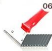
06 Perching Knife