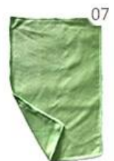
07 Scouring Pad