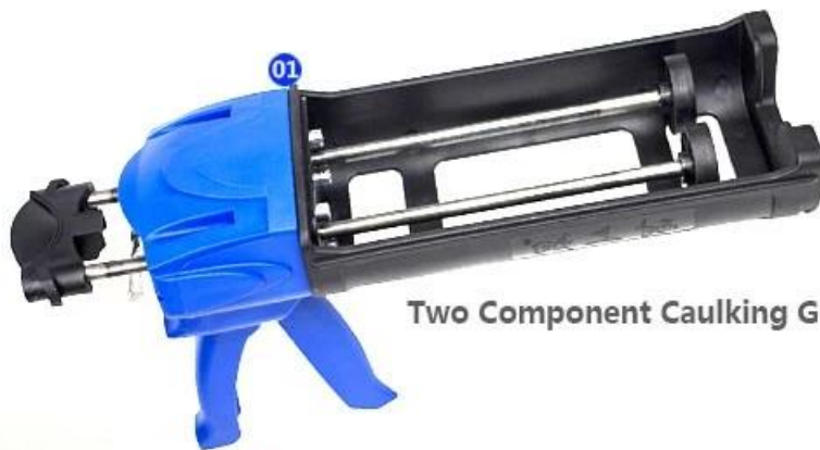
Two Component Caulking Gun