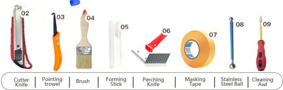
Cutter Knife | Pointing trowel | Brush | Forming Stick | Perching Knife | Masking Tape | Stainless Steel Ball | Cleaning Awl