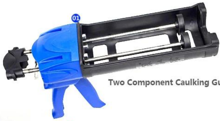
Two Component Caulking Gun