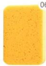
06 The sponge