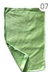
07 Scouring Pad