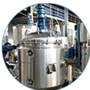
Creaming Machine Line