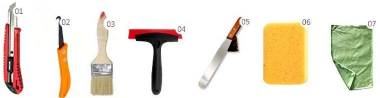
Cutter Knife | Pointing trowel | Brush | Rainbow Scraper | Stirring Knife | The sponge | Scouring Pad