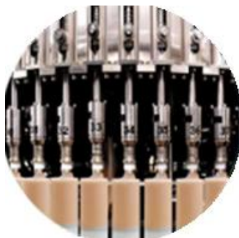
00 00 00