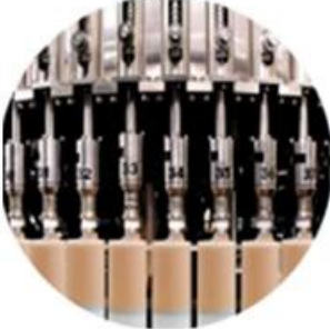
Filling Machine Line