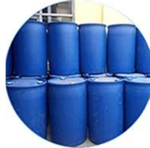
Real Material Stock