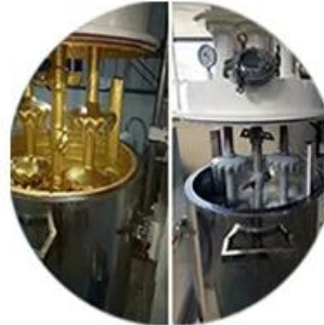
Batching Production Line