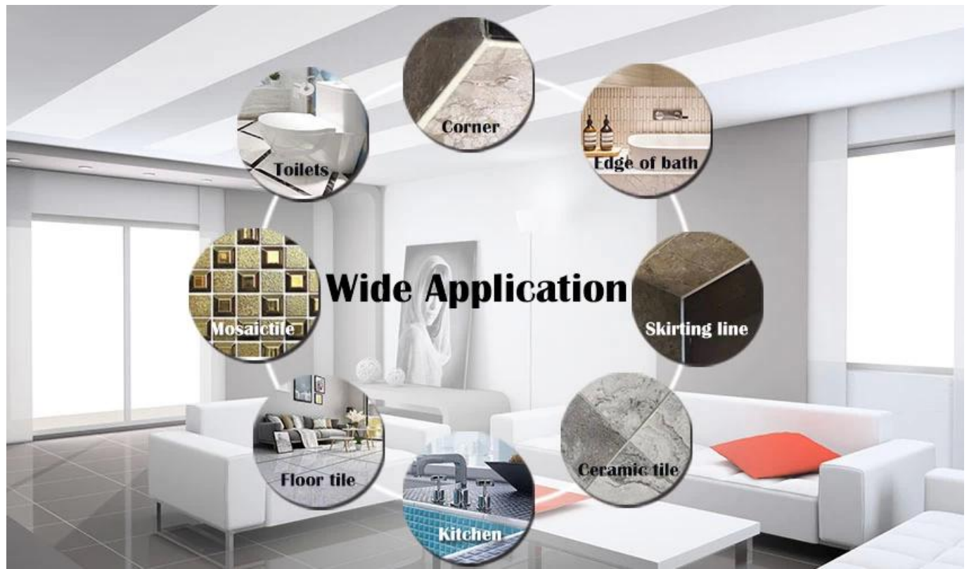
此 塗料 係 由 一 種 高 級 之 聚 脲 材 料 所 製 成。 此 塗料 係 由 一 種 高 級 之 聚 脲 材 料 所 製 成。

此 塗料 係 由 一 種 高 級 之 聚 脲 材 料 所 製 成， 且 具 有 優 異 之 耐 磨 損 性 能。 此 塗料 係 由 一 種 高 級 之 聚 脲 材 料 所 製 成， 且 具 有 優 異 之 耐 磨 損 性 能。 Kelin 係 一 種 高 級 之 聚 脲 材 料， 且 具 有 優 異 之 耐 磨 損 性 能。 此 塗料 係 由 一 種 高 級 之 聚 脲 材 料 所 製 成， 且 具 有 優 異 之 耐 磨 損 性 能。 此 塗料 係 由 一 種 高 級 之 聚 脲 材 料 所 製 成， 且 具 有 優 異 之 耐 磨 損 性 能。 此 塗料 係 由 一 種 高 級 之 聚 脲 材 料 所 製 成， 且 具 有 優 異 之 耐 磨 損 性 能。 此 塗料 係 由 一 種 高 級 之 聚 脲 材 料 所 製 成， 且 具 有 優 異 之 耐 磨 損 性 能。