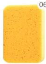
06 The sponge