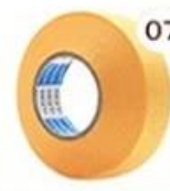
07 Masking Tape