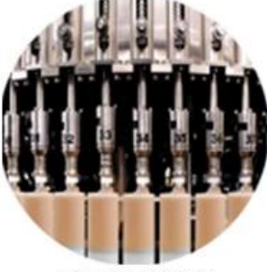
Filling Machine Line