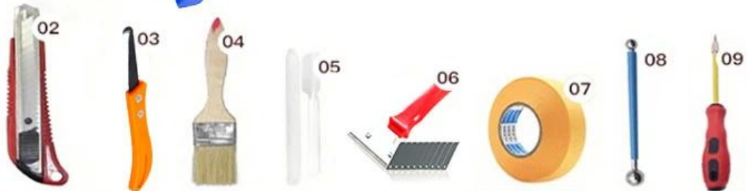
02 Cutter Knife 03 Pointing trowel 04 Brush 05 Forming Stick 06 Perching Knife 07 Masking Tape 08 Stainless Steel Ball 09 Cleaning Awl